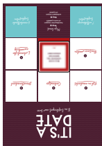
speelbord Henk met gekozen date