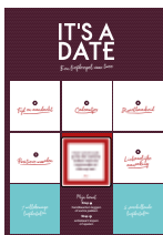
speelbord Chantal met gekozen date